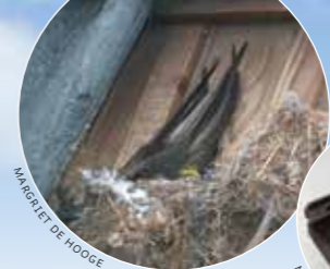
MARGRIET DE HOOGHE

Onder dakpannen kunnen nesten zitten van de huismus, spreeuw of gierwaluw. Ook vleermuizen zoals de laatvlieger en gewone grootvleermuis kunnen hier verblijven. Speciale dakpannen bieden ruimte voor vogels (tenzij het dak is geïsoleerd, kies dan in metselkasten) en vleermuizen. Laat voor vleermuizen ook een ruimte tussen dakpannen en dakbeschoot open en toegankelijk.