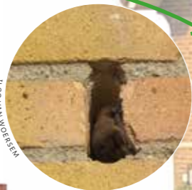
ILDO VAN WOESEM

Via stootvoegen of andere spleten kruipen gewone dwergvleermuizen graag in de spouw. Bij sommige huistypes nestelt de huismus ook in de spouw. Metsel vleermuis- of vogelkasten in of hang ze op aan de gevel. Ook kun je de spouw weer toegankelijk maken.